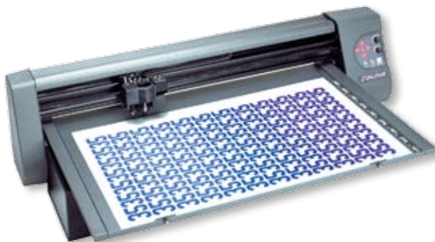
Ioline 300 System

Incrementa productividad Aumenta márgenes Disminuye costos